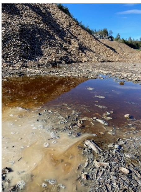
Bilder: Tjockt damm från byggavfall (RT-flis) precis intill sjön / Dagvatten eller lakvatten som rinner ut i grundvattnet och sjön