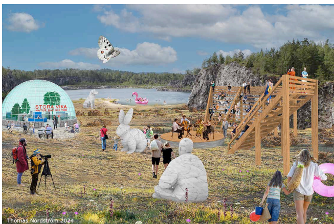
Bilder: Visioner för Stora Vikas kalkbrott (© Thomas Nordström)