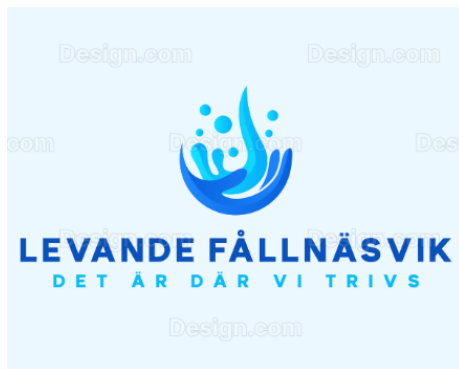
Bild: En ny logotyp är under utveckling