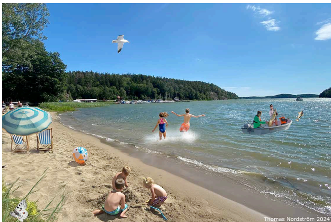
Bilder: Visioner för Fållnäs viken